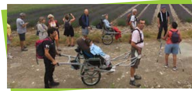
Des valides promènent des non valides à bord de Joëllettes.